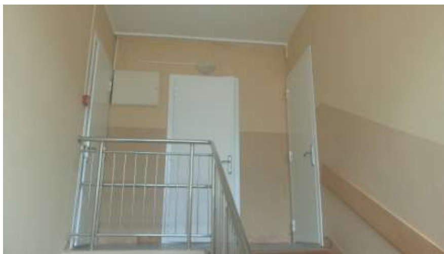
Сделан косметический ремонт одной группы

В 2016г. установлены 3 противопожарные двери